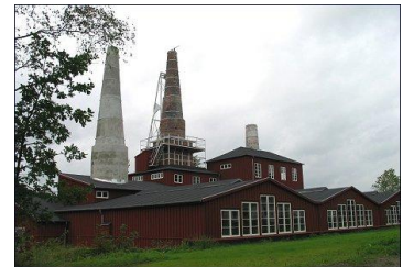
Modelfoto af et større værk

Til højre en lidt mere rationel type med ringovn, - en række kamre ved siden af hinanden, hvor brændingen foregår kontinuert, ved at ilden vandrer fra kammer til kammer. Ved at luften ledes til og fra brændekammeret, - ledes gennem det foregående og efterfølgende, sker der en forvarmning af henholdsvis luften og kalkstenen, dermed en meget bedre udnyttelse af brændslet. Holdbarheden på brændt kalk er forholdsvis kort tid, læskningen skulle helst i gang med det samme, derefter var kalken brugbar et par år.